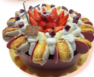
St Honoré aux fraises*