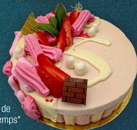
Perle de Printemps*