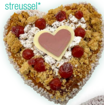
Cœur fraises/ streussel*