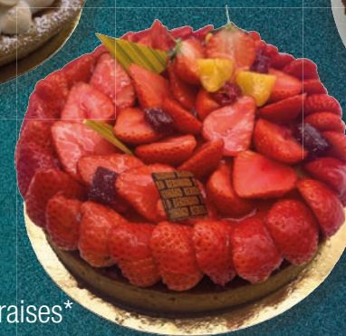
Tarte aux fraises*