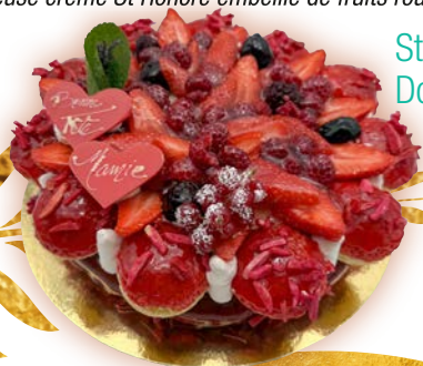
St Honoré Douce Saison*

Onctueuse crème St Honoré embellie de fruits rouges