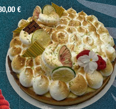
Tarte citron meringuée*

* Photos non contractuelles Les décors sont susceptibles d'être modifiés selon les arrivages ou selon la fantaisie du pâtissier