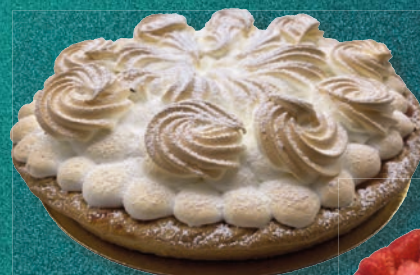
Tarte rhubarbe meringuée*