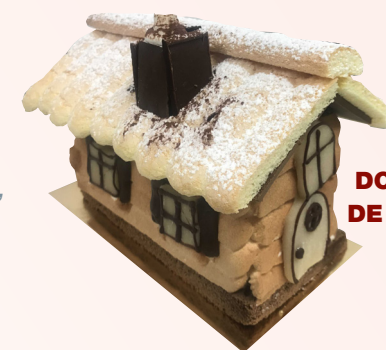
DOUCEUR DE MINUIT

Dôme glacé Parfait praliné éclat d'amandes et noisettes caramélisées, glace vanille, recouvert d'une coque meringuée